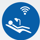
ZI LIVE CLINICAL

Bitte kontaktieren Sie uns für zusätzliche Informationen zu den folgenden Ausbildungsmöglichkeiten: