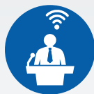
ZI LIVE WEBCASTS