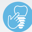
ZIPATHWAYZ ® PROGRAMS