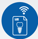
ZI LIVE CASE PRESENTATIONS