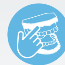
ZI IMPLANT SKILLZ ® SERIES