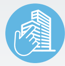
ZIMVIE INSTITUTE PROGRAMS